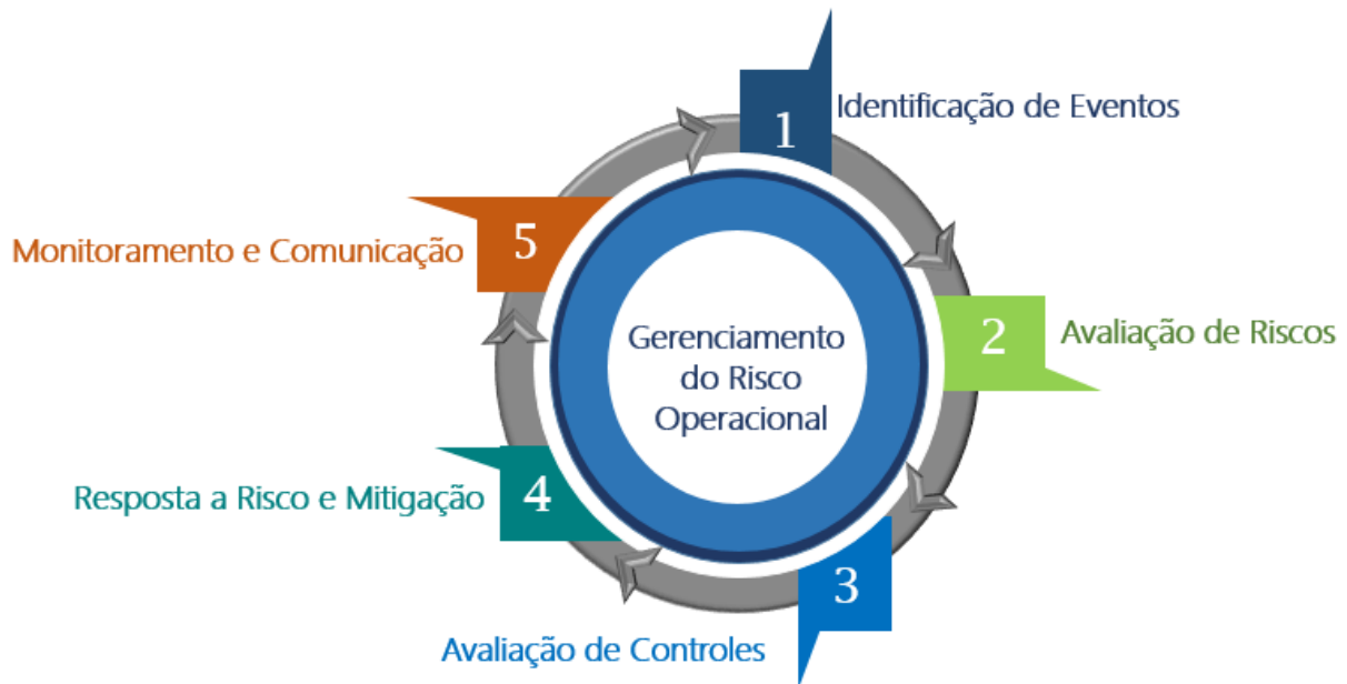
Diagrama 1 – Ações de Gestão